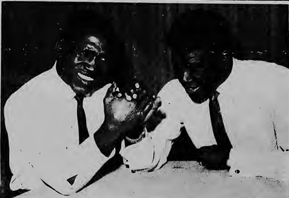
NEW YORK -- Campeon mundial di peso medio Dick Tiger na man robes y e campeón mundial di peso welter Emile Griffith ta fula puls despues di a ser anuncia cu nan lo enfrenta otro dia 25 di april pa e titulo di 160 liber di Tiger.

Di su parti e embahada di Francia a informa cu ambos bishitita prevista, pero cu ainda e fecha no a ser pone pa ningun di nan.